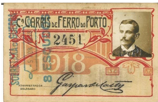
Figura 5. Sobretaxa de Guerra.

Adicionalmente, as datas presentes nos passes de Fortunato estabelecem uma interessante coincidência simbólica, abrangendo o período compreendido entre o início da I Guerra Mundial e o termo da II Guerra Mundial. O último passe remonta a 1944, um ano antes do fim oficial do conflito, em 1945 (Fig. 6). Deste modo, torna-se evidente que a deslocação do foco analítico, isto é - do objeto técnico isolado para a rede de significados sociais, económicos e históricos, - que revela o verdadeiro potencial da investigação e documentação de coleções museológicas.