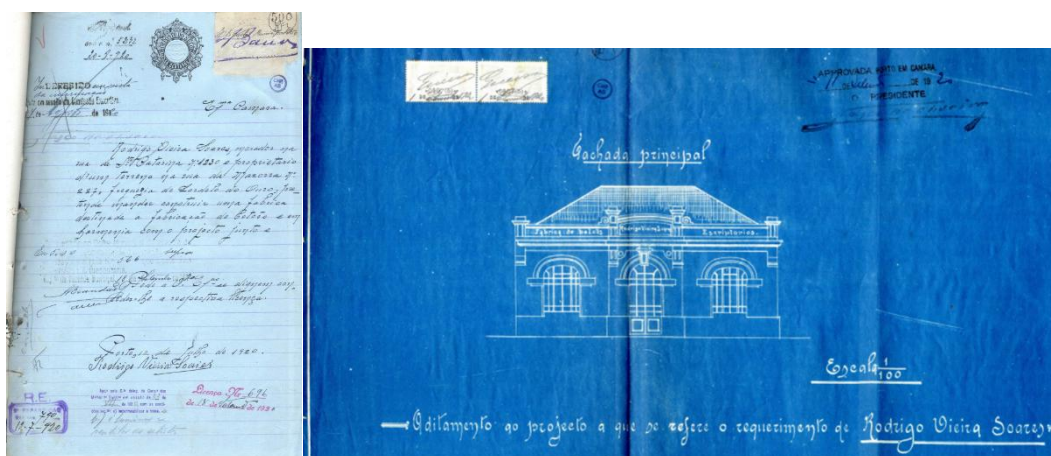
Figura 1. Documentação relacionada com a Fábrica Portuense dos Botões.