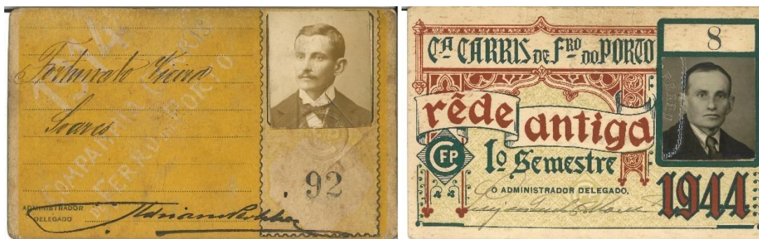
Figura 6. Passe de 1914 e Passe de 1944.