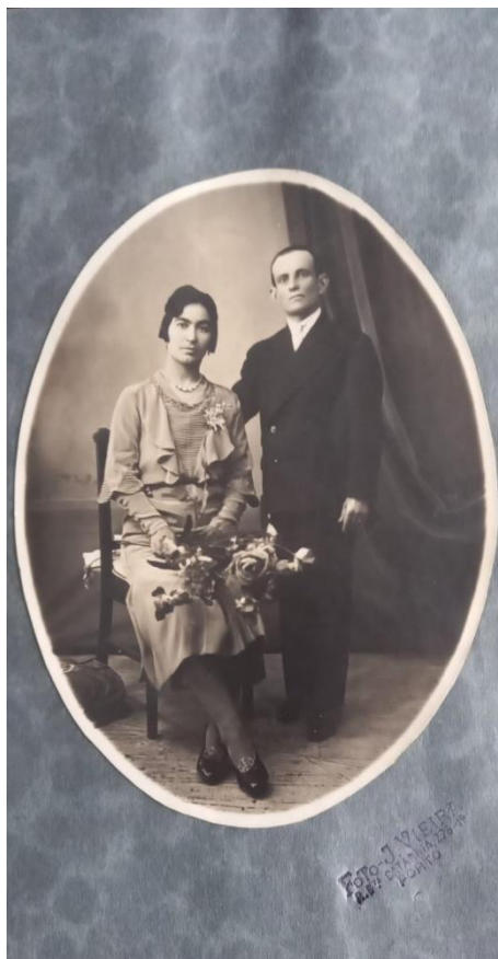
Figura 3. Fotografia de Casamento.