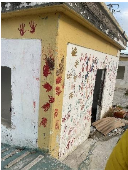
Figura 1. Mãos pintadas na parede do edifício que abrigava crianças desacompanhadas no Campo de Moria. © Matilde Gomes, 2024.

Desta forma, a ilha de Lesbos assume uma importância fundamental nesta investigação, uma vez que vários elementos da metodologia foram analisados e têm origem neste ponto geográfico, como quatro desenhos elaborados por pessoas em movimento, recolhidos no centro comunitário. Em conformidade com o exposto, a questão de investigação subsequente é apresentada: de que modo os museus, que atualmente promovem os princípios da democratização, inclusão e ativismo, podem acolher e representar o património difícil associado à migração contemporânea?