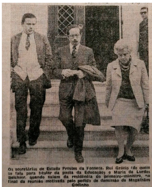
Fig. 2. Foto posterior à demissão de Vitorino Magalhães Godinho