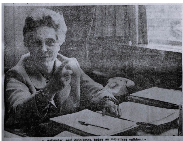
Fig. 4. Foto que acompanhava a entrevista

O Estado deve assumir as suas responsabilidades, sem dirigismos, sem coarctar a liberdade criadora dos artistas; têm de se inventar — no sentido etimológico da palavra — ou seja encontrar processos que salvaguardem a criatividade livre e ao mesmo tempo assegurem aos artistas condições de vida e de independência (Diário de Notícias. 1974-10-30, p. 8).