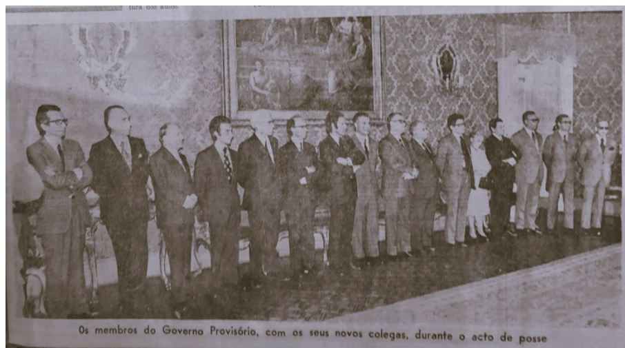
Fig. 1. Foto da tomada de posse de membros do I Governo Provisório

— O I, presidido por Adelino da Palma Carlos, esteve em funções entre 16 de maio e 11 de julho de 1974, tendo como Ministro da Educação Eduardo Correia, professor de direito em Coimbra;