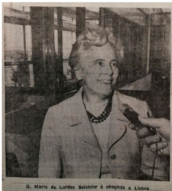
Fig. 3. Foto que acompanha a notícia

Férias da Faculdade de Letras de Lisboa. Mais importante, contudo, é a entrevista que o mesmo jornal publica a 30 de outubro, com chamada de primeira página: «Estimular sem dirigismos todas as iniciativas válidas» — declaração de princípios da Secretária de Estado dos Assuntos Culturais». Com realismo, a governante começa por reconhecer que «As actividades ou funções desta Secretaria de Estado [...] são de certo modo secundárias, se tivermos em contra as prioridades que o Governo tem de assumir [...]: a paz, a descolonização, a justiça social entre outras» ( Diário de Notícias . 1974-10-30, p. 7). Não perde, contudo, a oportunidade de criticar a orgânica do setor, antecipando uma orientação que só viria a ser adotada décadas mais tarde: